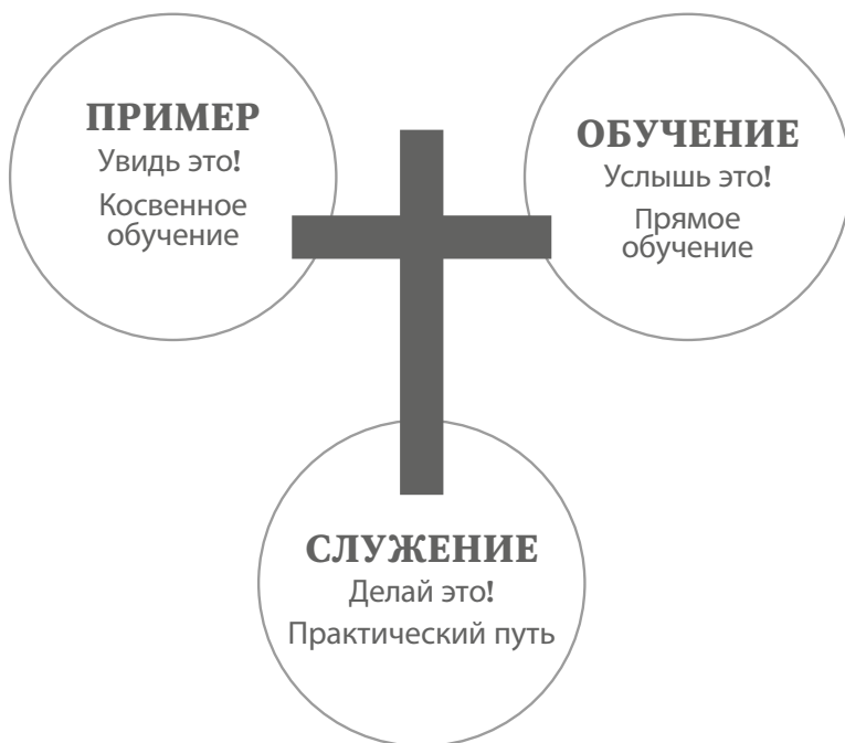
Рис. 1. Формирование мировоззрения вашего ребенка через личный пример, обучение и служение

о мире и ответы на самые глубокие вопросы жизни 3 . Кто я? Зачем я здесь? Откуда я? Куда я иду? Что правильно и что неправильно? Кто такой Бог?