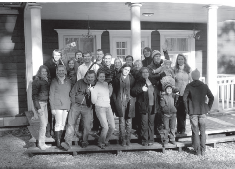
Korintas konference Ungurmuižā 2010

mūsu draudzes zāli pirms un pēc dievkalpojumiem un arī palīdzu mūsu tehniķiem ar tehnikas uzstādīšanu. Par bundzinieku kļuvu, pateicoties Korintas draudzei. Nespēju visu tik labi atcerēties, bet zinu, ka aptuveni tajā laikā, kad nokristījās, mūsu slavēšanas komandai trūka bundzinieka, bungas bija, bet nebija, kurš tās spēlētu. Kāds bija pamanījies manu interesi un uzaicināja mani pamēģināt. Mazliet gāju mācīties arī pie skolotāja, bet tajā visā bija Dieva vadība. Un tā jau pat vairs nevaru saskaitīt, cik gadus esmu mūsu draudzes slavēšanas komandā, bez kuras nevaru iedomāties savu dzīvi.