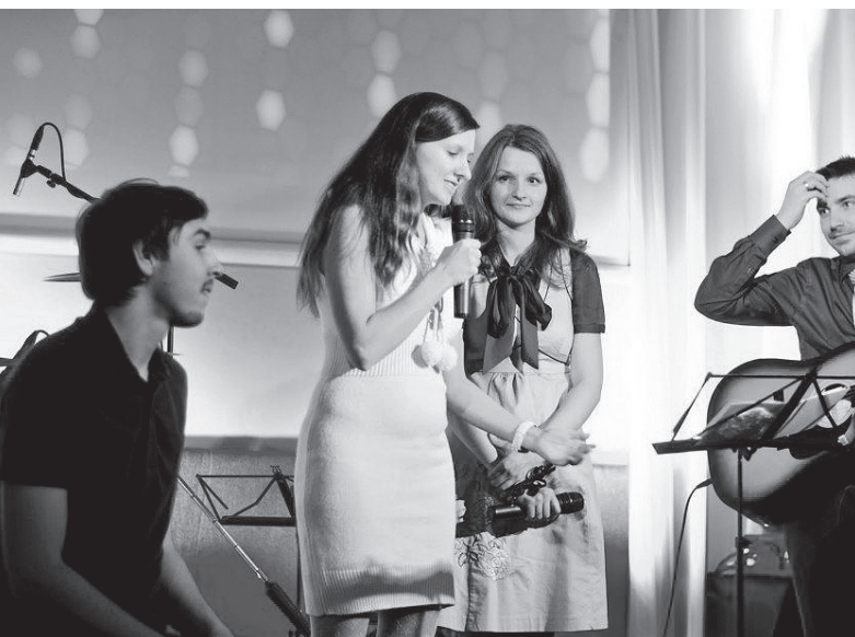
Koncerts "Dāvana Tev" 2012

Viens no spilgtākajiem notikumiem bija draudzes veidošanas konference, šķiet, 2004. gadā. Spilgti atceros to visu nedēļu, jo nekad nebiju piedalījies iepriekš šāda veida seminārā. Tik daudz cilvēku no dažādām valstīm, lieliski vadītāji! Tik ļoti sajutu Dieva klātbūtni, ka negribējās, lai šī konference beidzas! Man tā bija arī iespēja iepazīt vairāk sevi un saprast, kāpēc mēs vispār nākam uz draudzi, kāpēc tajā piederam, kāpēc ir tik ļoti svarīgi būt draudzē.