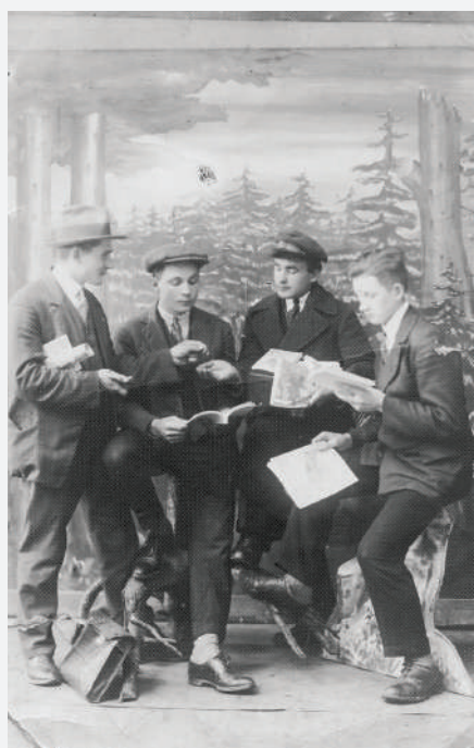
Kolportieri 20. gs. 20. gados.

Misijas darbs bija cieši saistīts ar literatūras izdošanu un izplatīšanu. Tādēļ, līdzko pēc neatkarības iegūšanas pavērās iespējas, brīvprātīgie ar literatūru devās druvā un sludināja. Tāds salīdzinoši zelta laiks misijas kalpošanai bija divdesmitie gadi, kad tika dibinātas jaunās draudzes. Ja pirms kara pastāvēja 11 draudzes, tad 1923. gadā to bija jau 33, bet 1932. gadā – 59!