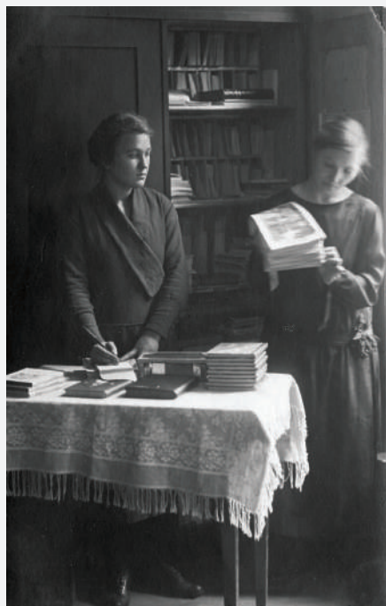
Grāmatu skapis 20. gs. 20. gados.