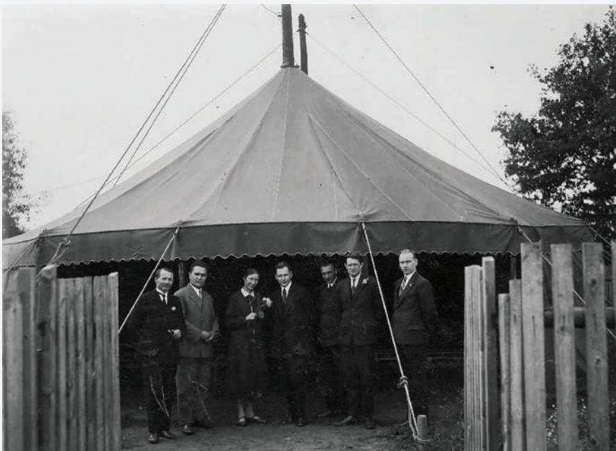
Evāņģelizācijas telts Rīgā 20. gs. 30. gados.