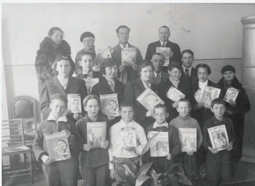
Rīgas 4. draudzes literatūras izplatītāji. 20. gs. 30. gadi.