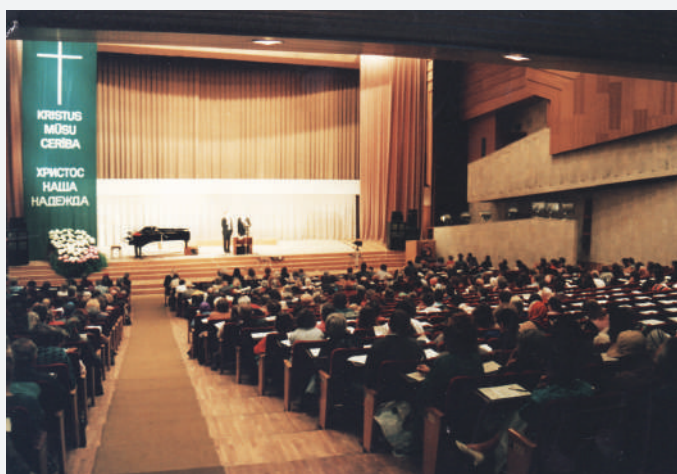
K. Mitlaidera vadītais seminārs Rīgā 1992. g.