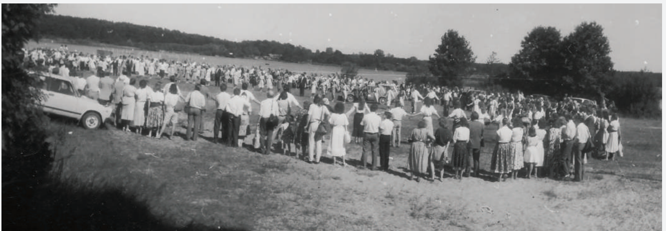
Sagatavošanās kristībām pēc Dž. Kolona semināra 1991. g.

Misijas darbu pastiprināja misijas skola Sužos, kurā sagatavoja jaunos kalpotājus. Kolportāžas darbā iesaistījās daudzi jaunieši, viņiem tas bija pirmais šāda veida misijas darbs. Arī draudzes laikrakstos regulāri tika publicēti panākumi misijas laukā. 1936. gadā Latvijā bija 1936 adventisti.