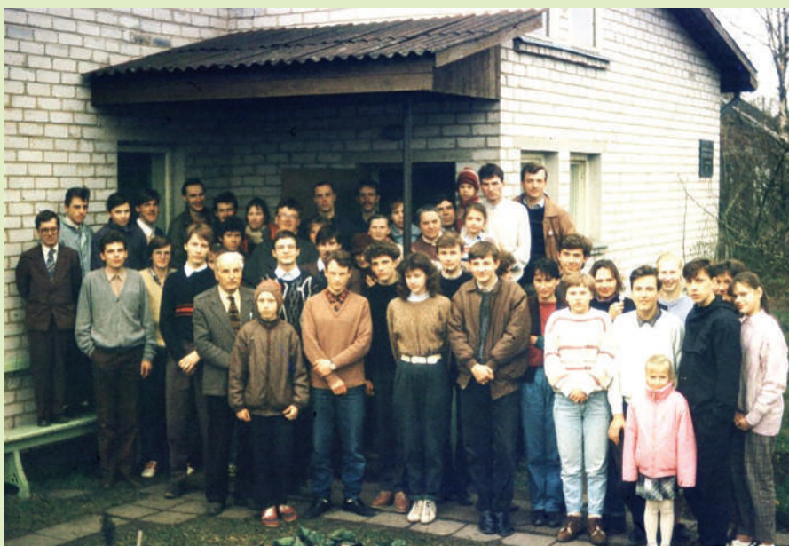
Jaunieši – literatūras izplatītāji pie Dobeles draudzes nama 1993. g.

Draudzes locekļu kritums 1984. gadā bija sasniedzis 1778, un šī lejupslīde turpinājās, līdz iesākās t.s. Atmosdas laiks.