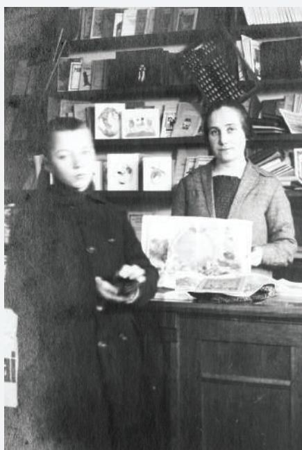
Talsu misionāri 1928. g.