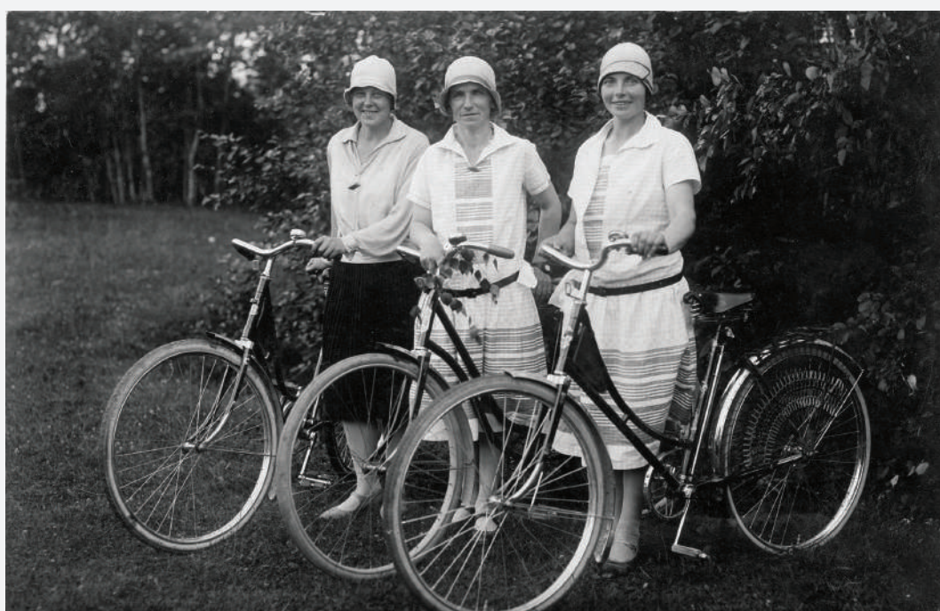
Kolportieres Urule, Fingere un Meiere pie Beverīnas kalna 1930. g.