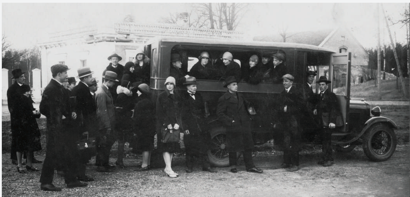
Misionāri dodas izbraucienā no Sužiem ar autobusu.