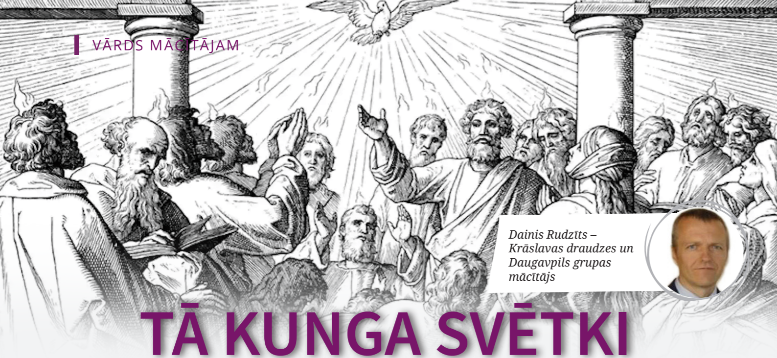
Dainis Rudzīts – Krāslavas draudzes un Daugavpils grupas mācītājs